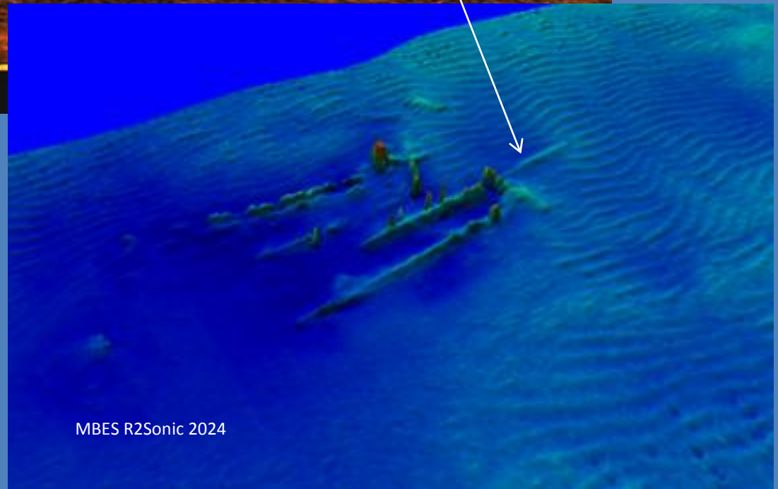
MBES R2Sonic 2024